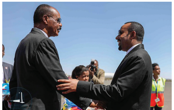
Der äthiopische Premierminister Abiy begrüßt den eritreischen Staatspräsidenten Isaias Afewerki.

Abiy leitete umgehend Reformen zur demokratischen Öffnung des Landes ein, was nach Jahrzehnten der autoritären Führung des Landes von den Menschen sehr begrüßt wurde. Zudem sprach sich Abiy für die Überwindung der ethnischen Spaltungen im Lande aus. Er wolle das Land zusammenbringen und versöhnen, sowohl innerhalb der Landesgrenzen als auch mit den Nachbarländern, insbesondere dem ehemaligen Erzrivalen Eritrea.