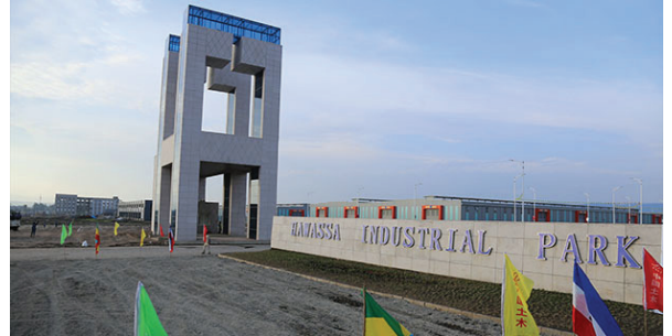
Der Hawassa Industriepark ist die aktuell größte Produktionsstätte für Kleidung im Süden des Landes.

nächsten Jahren initiiert. Dort sollen neben der internationalen Textilbranche auch andere weiterverarbeitende Gewerbe ansässig werden.